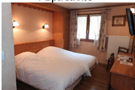
Chambre 2 lits – côté rue 1-2 personnes