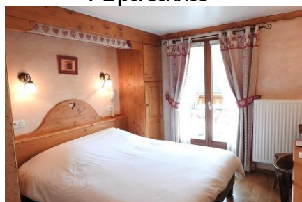
Chambre vue vallée – balcon 1-2 personnes

Demi-Pension (7 nuits et plus): 61 € par jour et par personne