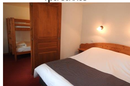
Chambre communicante famille 4 personnes

Demi-Pension (7 nuits et plus): 71 € par jour et par personne